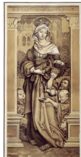
Foto: Von Hans Holbein der Ältere - see description, Gemeinfrei, https://commons.wikimedia.org/w/index.php?curid=3863474

Wie kann ich eine goldene Krone tragen, wenn der Herr eine Dornenkrone trägt!